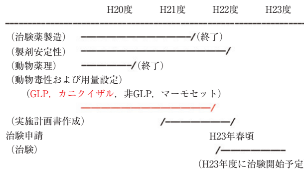
Fig. 2 ヒト組み換え HGF 蛋白質製剤の開発スケジュール.

HGF 投与によって脊髄の運動ニューロンにおいて HGF の受容体が活性化される一方で、細胞に死をもたらすカスパーゼの活性化の抑制が確認された。さらには運動ニューロンの周辺にあるアストロサイトではグルタミン酸トランスポーターである EAAT2 の病態進行にともなう低下が抑制された。