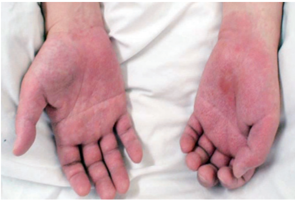
Fig. 1 Pompholyx of palms.

Underlines indicate conduction block. Conduction block was improved in July 2009.